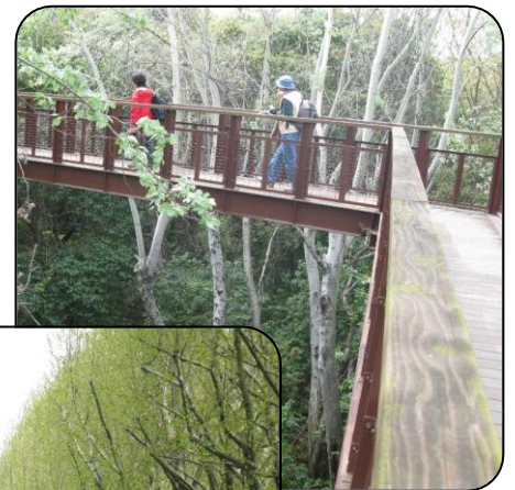
森の空中観察路 (ソラード) →