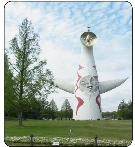
今も万博公園のソボルは「太陽の塔」 ↑