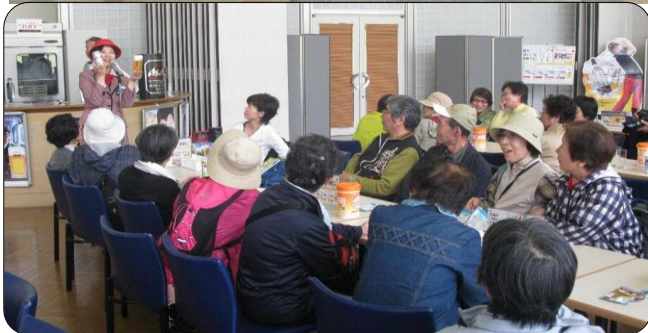
美味しいビールの注ぎ方講習 ↑