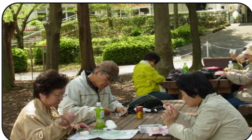
↑ 野外でのお弁当は、ウォーキングの醍醐味