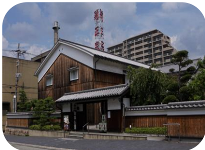
菊正宗酒造記念館