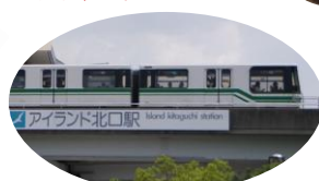
アイランド北口駅