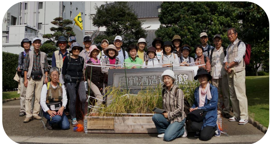
ちょっとほろ酔い気分でハイポーズ