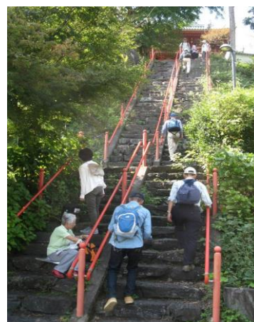
勝利寺への階段は真に勝利への道か? ↑