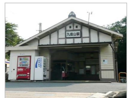
スタートとゴールの九度山駅 ↑