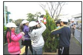
主催：泉北ニュータウン学会 / 後援：堺市南区役所