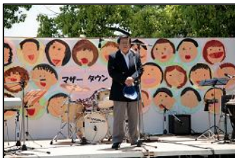
開会式で挨拶する竹山堺市長

当日の復興支援として集まった義援金(20,888円)は、日本赤十字社を通して、被災地へ送金しました。ご協力各位に改めまして厚く御礼申し上げます。