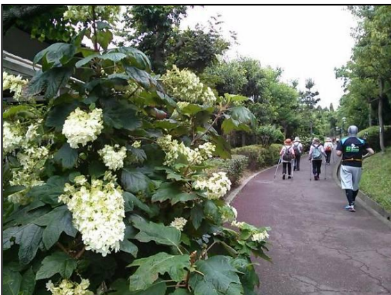
☆赤坂台公園の緑道、紫陽花が満開でした☆

参加者 60名の皆さんから次回の開催の要望をたくさん頂きました。本当にお疲れさまでした。