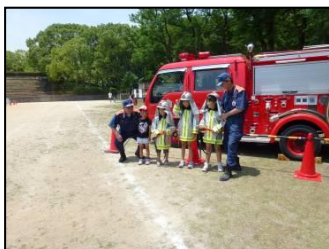
消防服で記念写真☆

当日の早朝からの設営・運営には学生ボランティア（桃山学院大学、成美高校、帝塚山大学、ベトナム・スウェーデンからの留学生）、一般ボランティア、参加団体からのボランティアの方々に協