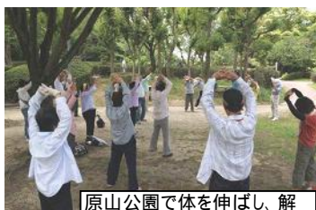
原山公園で体を伸ばし、解