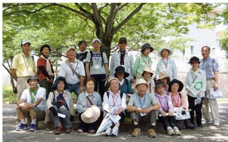
御池公園入り口で記念撮影