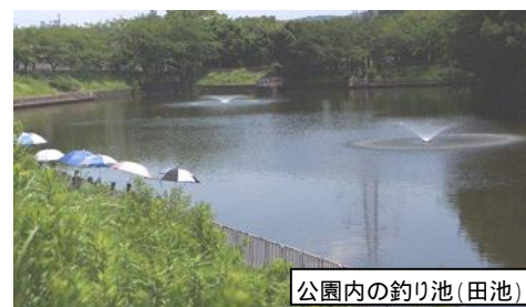
公園内の釣り池(田池)