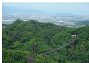
展望スポットよりの眺望

その後、本日のもう一つの目玉ポイントである「展望スポット」前のやまびこ広場で、小休憩、上りの坂を頑張ると展望スポットに到着であるが、険しい登り坂である為、2名は展望行きを断念し広場で休憩、残るメンバーで、展望スポットに到着した。展望スポットからは、能勢の妙見山、枚方方面から、京都方面の男山、京都タワーが望める絶景ポイント、各自、写真撮影等した後、再び、やまびこ広場で全員集合の後、下山となった。