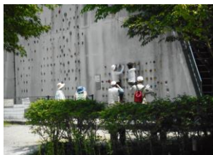
壁にチャレンジするメンバー