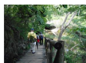
山道を下山、私市駅に向う