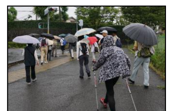
雨中のウォーキング