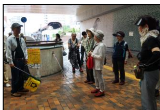
解散、お疲れさまでした。