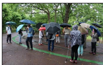
ウォーキングコース変更の説明