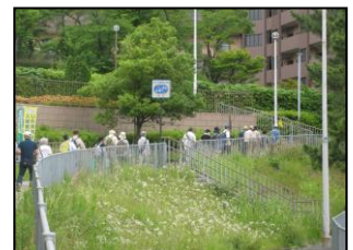
雨を心配しながらスタート