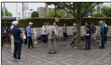
本日の連絡事項の説明