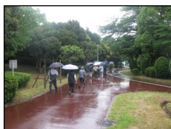
ゴールまであと少し