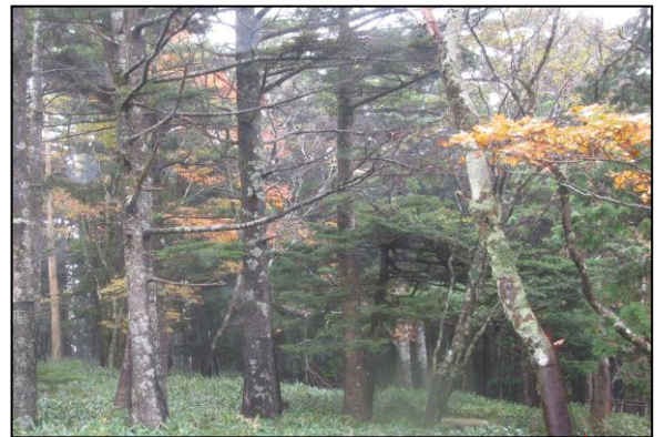
雨に打たれても大台を味わいたい元気者、 落葉と苔とミヤコ笹の中を楽しんできました。