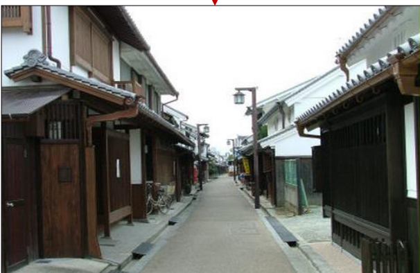
今井町まちなみ交流センター 「花藁」前にて