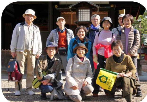
住吉大社で記念撮影