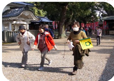
住吉大社境内お疲れ様でした