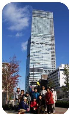
あべのハルカスをバックに記念撮影