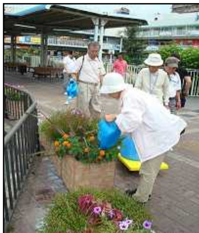
「地域の方の水遣り」