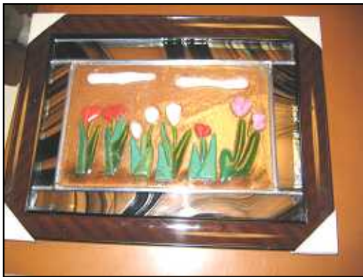
【第4回 ステンドグラス教室の作品】