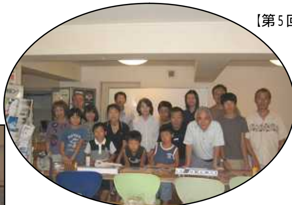
【第3回 鉄道模型教室】