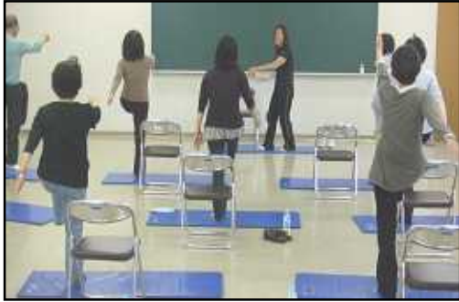
【第1回 健康体操～太らない身体づくり】