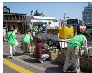
8月13日猛暑の中の花の管理