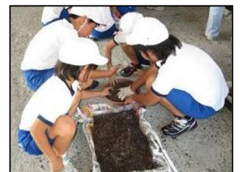
桃小生徒の来春の花の準備中